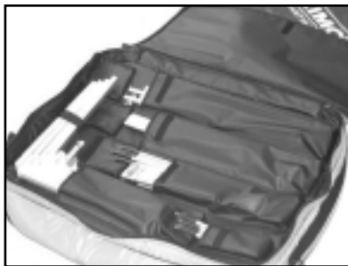
Sac de transport