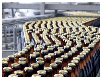
Contrôle d'étanchéité des dispo- sitifs de remplissage (sécurité)