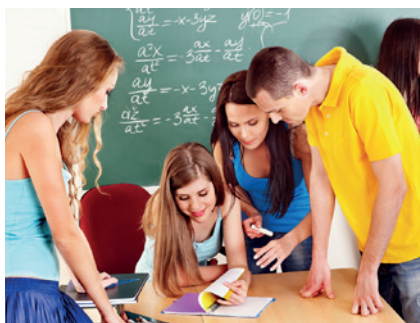
Qualité de l'air en intérieur (Indoor Air Quality)