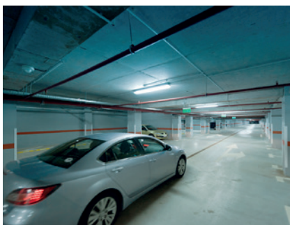
Surveillance de garages souterrains (sécurité)