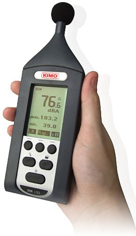
*Livré avec écran anti-vent