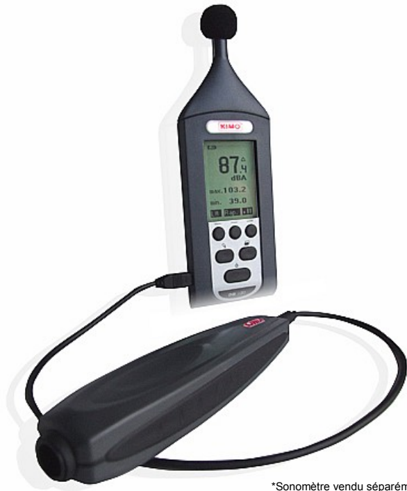
*Sonomètre vendu séparément