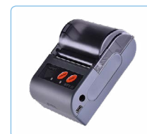
Imprimante Bluetooth® (Si-AQ Imprimante BT)