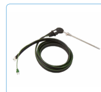
Sonde d'échantillonnage (Si-AQ Sonde + Raccord)