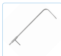
Tube de Pitot pour la vitesse d'air (Si-AQ Pitot Tube)