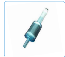
Filter d'étalonnage (Si-AQ VOC Filtre zéro)