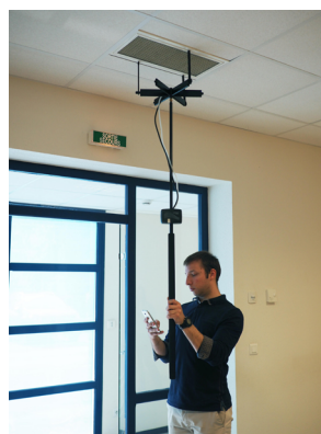
Utilisation avec la grille de mesure