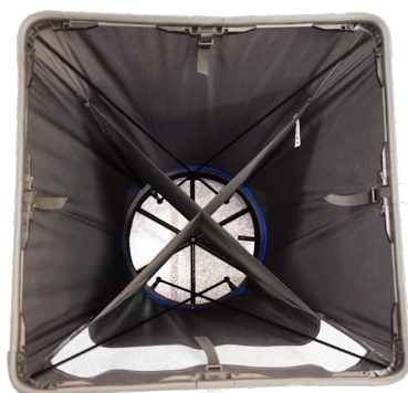
Hotte avec redresseur de flux