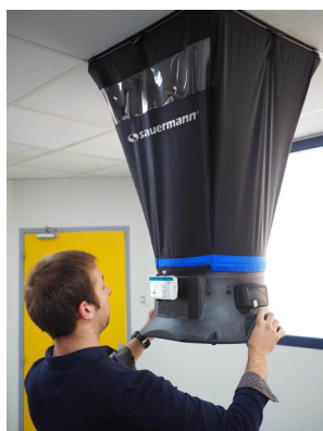
Mise en situation du débitmètre