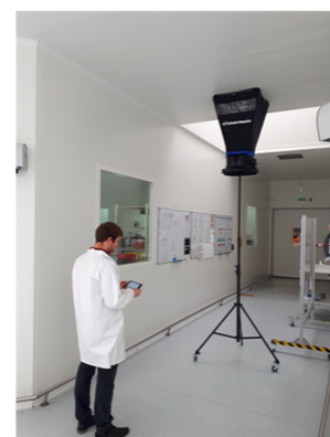
Utilisation avec le trépied télescopique