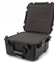
*Shown with foam option. * Montré avec option mousse.

At 21.5 inches long and nearly 11.8 inches deep, the NANUK 968 can store a whole lot of your essentials. The NANUK 968 hard case offers the maximum level of protection for all of your professional equipment. The protective case adds the convenience of wheels to make traveling much easier with your audio gear, video gear, photo gear, industrial equipment, outdoor gear and much more! Three soft-grip handles make this wheeled case one of the most convenient on the market. The NANUK 968's polyurethane wheels withstand rough terrains while the one-handed retractable handle offers unparalleled usability. No matter where you go you're guaranteed a smooth ride. For total equipment protection, look no further than the NANUK 968's indestructible waterproof resin shell and patented superior PowerClaw latches. Trust the world's best protective case to get your gear safely from point A to point B.