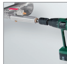
Perçage sous pression avec le dispositif de perçage CS

Grâce à un dispositif de perçage, il est possible de percer sous pression au travers du robinet à boisseau 1/2" dans une canalisation existante. Outil avec récupération des copeaux dans le filtre prévu à cet effet. La sonde peut ensuite être installée comme décrit au point 1.