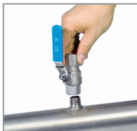
A Bossage fileté

B Installer un collier de prise, vendu avec un robinet à boisseau (voir la section Accessoires).